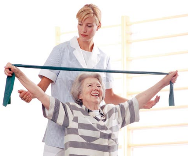
Für Pflege und Therapie nach Maß sorgt unser kompetentes Fachpersonal.