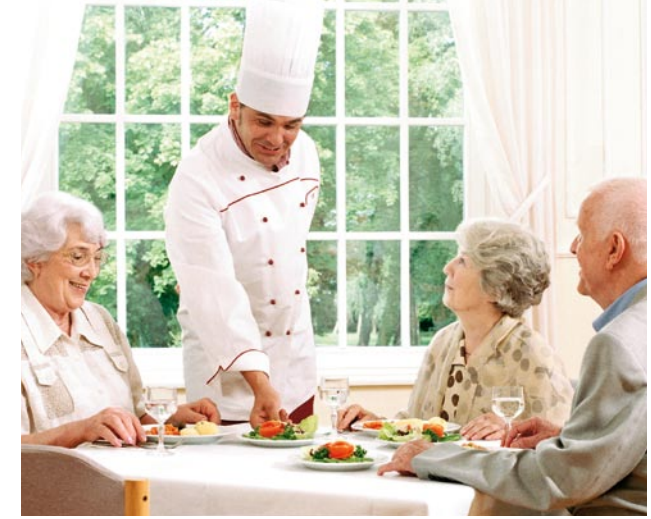
Unsere Küche stellt sich ganz auf individuelle Wünsche und gesundheitliche Ernährung ein