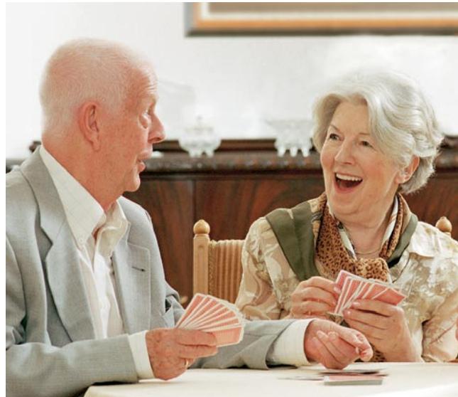
In der AMARITA fühlen sich die Bewohner in stilvoller Atmosphäre wohl.

Regelmäßig bieten wir seniorenrechtliche Gymnastik im Therapieraum an.