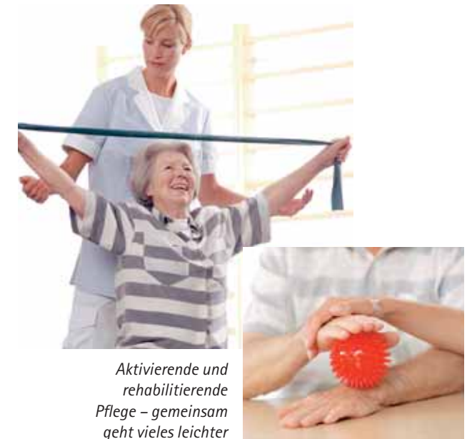
Aktivierende und rehabilitierende Pflege – gemeinsam geht vieles leichter