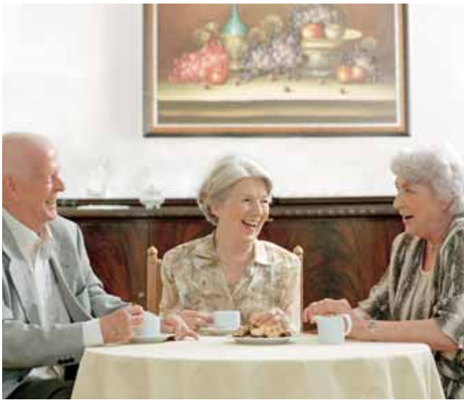
Freundliche Atmosphäre und harmonisches Miteinander genießen