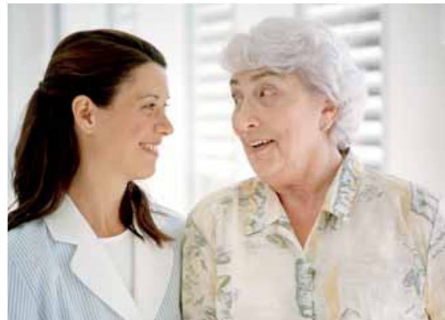
Unsere Mitarbeiter sind stets für Sie da und haben ein offenes Ohr für Ihre Wünsche und Sorgen

Der Senioren-Wohnpark liegt im Stadtzentrum. Sein kompetentes Pflegeteam sorgt dafür, dass Sie sich schnell wohlfühlen. Schon beim Betreten des Hauses spüren Sie die freundliche Wohnatmosphäre. Das Foyer ist beliebter Treffpunkt für geselliges Beisammensein.